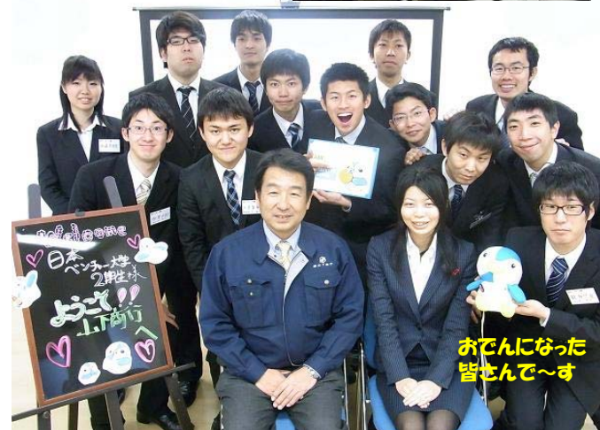
おでんになった皆さんで～す

→ウエルカムボードまでご用意いただき、山ピー(自社のキャラクターだそう)クッキーまでごちそうになった。ベンダイ生たちは感極まって……。