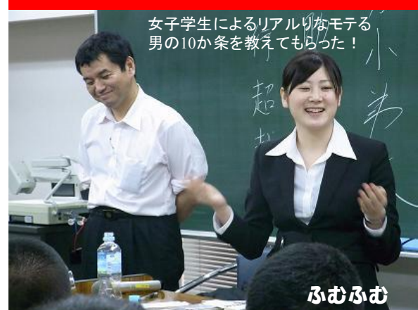
女子学生によるリアルなモてる男の10か条を教えてもらった！