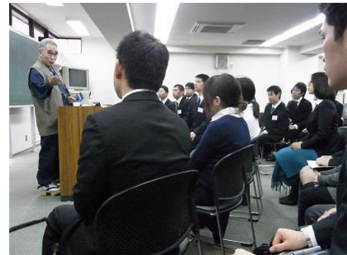
↑「私のあだな名は、野生の鴨」から始まった...