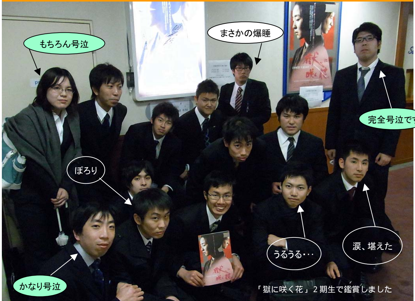
「獄に咲く花」2期生で鑑賞しました